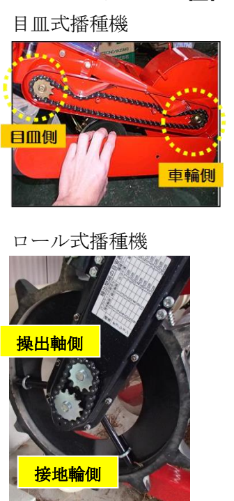
■スプロケットの位置

※ 播種量は、大粒種子(百粒重:えんれいのそら 35.8g、シュウレイ 37.0g、オオツル 40.0g)で計算。