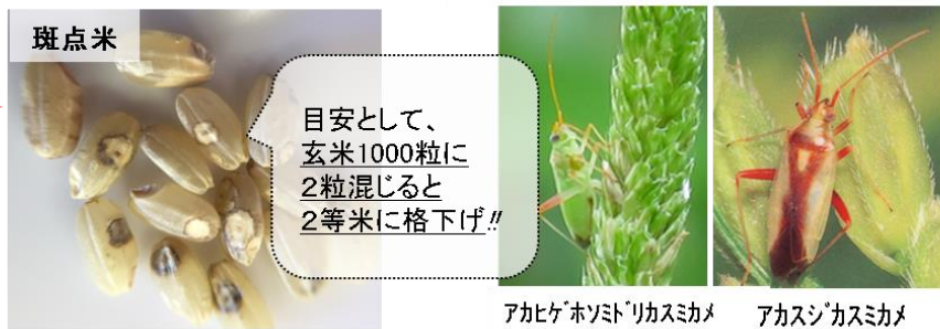
アカヒゲホソミドリカスミカメ アカスジカスミカメ