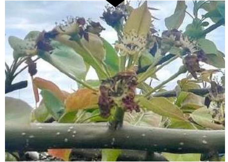
写真 花そうの萎れ(上:4/12、下:4/17)