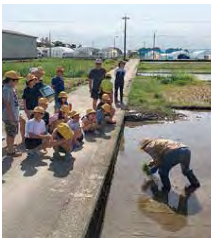
田植えのやり方を教わる小学生

五月二十五日、食農教育の一環として、北部支店管内の浜黒崎小学校の生徒たちは、地元組合員の協力のもと、北部支店職員と一緒に田植え作業を行いました。生徒たちは、慣れない作業に苦戦しながらも田植えを楽しんでいました。秋には稲刈りも行う予定です。