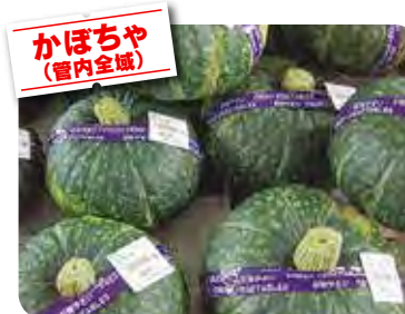
かぼちゃ (管内全域)

淡泊な味のなすは日本人の嗜好にぴったりです。浅漬けはもちろん、焼きなす、味噌炒め、田楽、煮物、天ぷらなど和食にも、洋食にも活躍します。