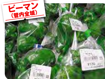
ピーマン (管内全域)

ジャガイモのビタミンCは加熱しても壊れにくいのが特徴。新ジャガは皮が薄くみずみずしいのでこの時期ならではの食べ方をお楽しみいただけます。