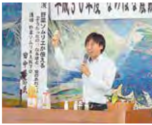
「こめ油」の商品研修