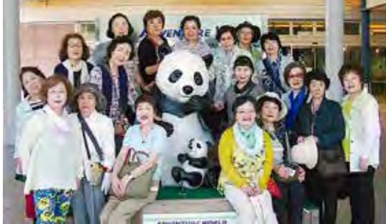
アドベンチャーワールドで記念撮影

三日目は親子パンダを間近に見て可愛さについて大声をかけてしまいました。昼はマグロの解体ショー後の刺身やたぐさんの料理の食べ放題を満喫しました。マグロのいろいろな部位の刺身は甘くてもちもちで本当に美味しかったです。この三日間は、バスに乗れば小雨、降りれば晴れ、食べ物もバラエティに富み全員笑顔で元気に大きなお土産とともに家路につきました。