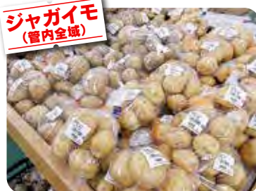
ジャガイモ (管内全域)

今回の改装で切花・鉢花コーナーを新設いたしました。また青果コーナーは通路を広く新鮮な野菜や果物をより快適にお選び頂けるようになりました。引き続きご愛顧のほどお願いいたします。