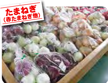
たまねぎ (赤たまねぎ他)

【お問い合わせ先】五福ショッピングセンターアリス1階 JAなのはな旅行センター 電話076 (439) 3336