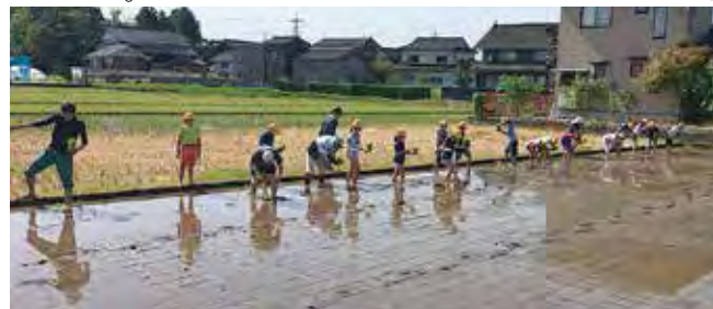
田植え作業する小学生と支店職員