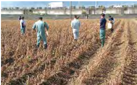
大豆の刈取適期巡回 和合支店管内のほ場にて