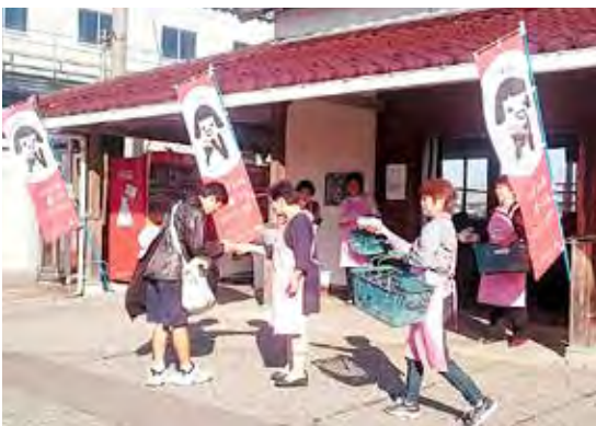
学生達におにぎりを配る女性部員

十月十一日、富山米新品種の「富富富」が、全国で一斉に発売されました。発売当日の農産物直売所では、開店前から行列をつくり、用意した200袋は約一時間で完売しました。急ぎよ追加した100袋も当日中には完売となりました。管内では今年、48経営体が「富富富」を41・2ヘクタールで栽培しました。 「富富富」の名称には「富山の水、富山の大地、富山の人が育てた富山づくしのお米」「食べた後の幸せな気持ち（ふふふ）を表す」「富」は豊かさやめでたさにつながる」といった思いが込められています。 ①粒ぞろいが良く、うま味と甘味が際立っている ②いもち病に強く、農薬使用量が削減できる ③高温に強く、白米熟粒が少ない ④草丈が短く、倒状しにくい等の特徴があります。県内を代表するブランド米として定着することが期待されます。