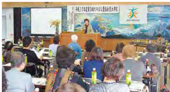
上滝女性副部長のあいさつ