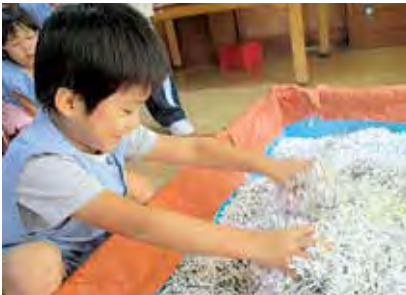
芋掘りゲームを楽しむ子供たち