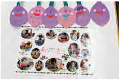
子供たちからもらったお礼のメダル

後日、女性部（池多支部）により掘っていただいたさつまいもを園へ届け、体育館の中で芋掘りゲームが開催され、給食では大学いもが提供されました。「あったあった」「わー大っきい」「すごい」など、みんなで楽しくゲームをし、子供たちからはお礼のメダルをもらいました。