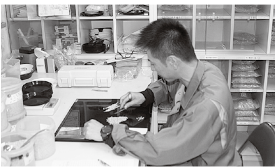
入念に検査する農産物検査員