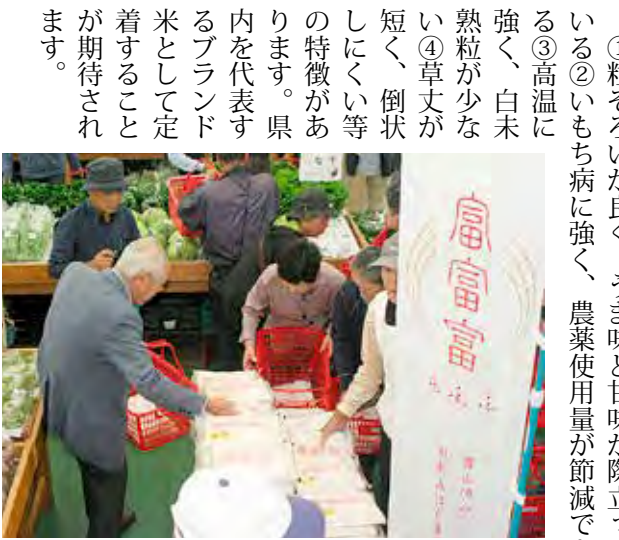
「富富富」を買い求めるお客様

十月二十三日、「和合給油所」の新築工事起工式が、富山市田尻東の和合支店北側の建設用地に関係者約三十人が出席して執り行われました。来年三月のオープンを予定しています。 国道8号豊田新屋立体事業計画に伴い、長年にわたり組合員の皆様にご利用いただきました豊田給油所につきましては、新しく和合給油所が完成次第、廃止いたします。また、集中配送体制の構築、各種施設の整備など、早期実施に向けて作業を進めてまいります。