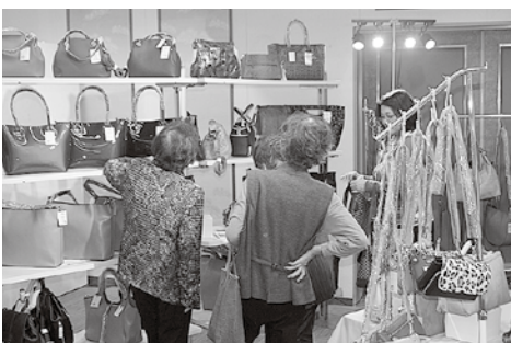
入念に品定めをするお客様