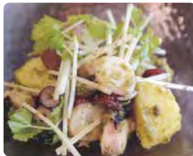
タコとジャガイモの バジルあえ