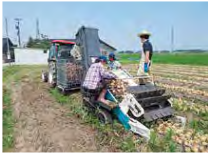
(写真2) 拾い上げ作業

昨年の10月末から11月上旬に定植されたたまねぎは順調に生育し、6月中旬に収穫時期を迎えました。収穫作業はまず、たまねぎの葉を切り堀あげる根葉切り作業（写真1）を行い、圃場で約7日間乾かした後、圃場から拾い上げる拾い上げ作業（写真2）を行いました。収穫作業は6月26日まで行われました。