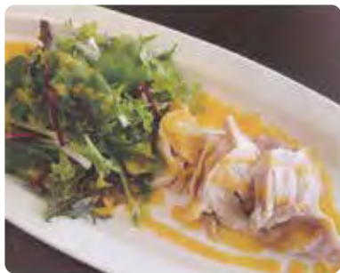
やわらか 蒸し鶏サラダ