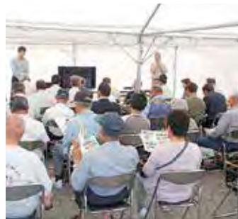
展示会場にて座学研修