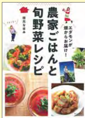
エダモンが畑からお届け! 農家ごはん&旬野菜レシピ 定価: 1,300円+税

人気料理研究家の著者が全国の農家を訪ね、野菜の収穫を手伝いながら採りたての野菜でとびきりおいしいごはんを作る! 収穫時期の見極めや、農家のおすすめレシピも併せて紹介。各県の特産品もよくわかる。