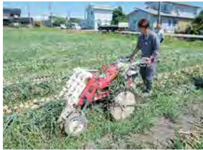
(写真1) 根葉切り作業

令和元年度第6回J A富山県女性協ママさん大学「房総半島と古都鎌倉・箱根路3日間の旅」になのはな農協女性部27名が元気に参加しました。 1日目は、猛暑の埼玉県川越の散策後、千葉県「海ほたる」P Aの潮風に吹かれ造った人間の力に感動!! 2日目は、おおつの里のびわ狩り、ハウスの中の大きなびわを剥いて食べて食べて・・・指が橙色に。鋸山のロープウェイは登ったら厳しい石ごころの下山が待っていました。金谷港からあつとという間に神奈川県に入り、大仏様に手を合わせて祈るは健康と旅の安全。3日目は、涼しい曇り空、噴火の影響で大涌谷は行かず、強風で芦ノ湖遊覧は運休だった