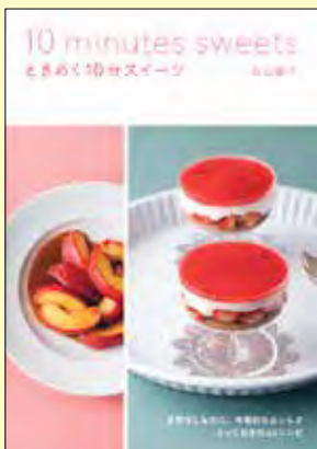
ときめく10分スイーツ 定価: 1,200円+税

人気料理家による、短時間&少ない材料で作れるとびきりおいしいスイーツレシピ。オレンジのティラミスやレアチーズケーキ、パンケーキ、ゼリー、ババロアなど、心躍るスイーツがあつという間にできあがる!