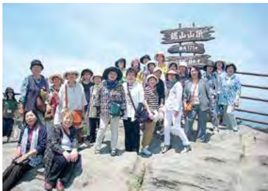
鋸山山頂で記念撮影

令和元年度第6回J A富山県女性協ママさん大学「房総半島と古都鎌倉・箱根路3日間の旅」になのはな農協女性部27名が元気に参加しました。 1日目は、猛暑の埼玉県川越の散策後、千葉県「海ほたる」P Aの潮風に吹かれ造った人間の力に感動!! 2日目は、おおつの里のびわ狩り、ハウスの中の大きなびわを剥いて食べて食べて・・・指が橙色に。鋸山のロープウェイは登ったら厳しい石ごころの下山が待っていました。金谷港からあつとという間に神奈川県に入り、大仏様に手を合わせて祈るは健康と旅の安全。3日目は、涼しい曇り空、噴火の影響で大涌谷は行かず、強風で芦ノ湖遊覧は運休だった