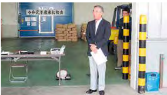
川腰組合長のあいさつ