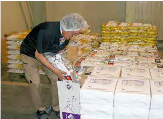
発送準備をするJA職員

組合員の方々にもご協力を賜り、新米が発売されるこの時期は、各地より多数の注文を受けております。