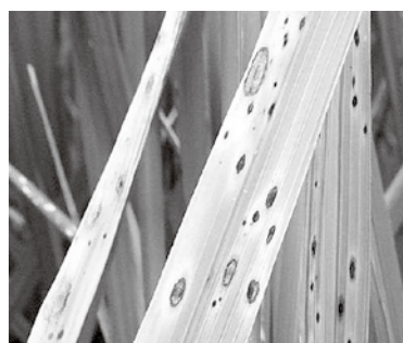
<写真 ごま葉枯病の病斑>

近年、ごま葉枯病（写真）の発生が増加傾向となっています。この病気は、 土壌中のケイ酸、カリ、鉄分含量などの低下 により発生が増加します。