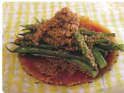
インゲン ごましようゆ掛け