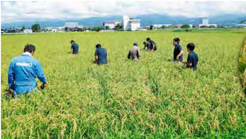
富山農林振興センターの職員と当J A営農指導員によるほ場での刈取適期確認の様子