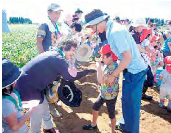
芋掘りを楽しむ子供達