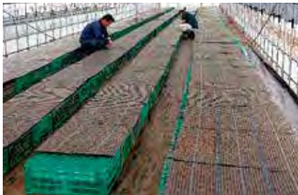
(写真1)並べた直後のハウス

八月二十八日に全農とやまで播種を行ったセルトレイ900枚をグリーンパワーなのはなの育苗ハウス2棟を借り育苗を行っています。育苗期間中には4回の病害虫防除、3回の液肥散布、4回の追肥、5回の剪葉(写真2)と10月中旬の定植まで約50日間大変多くの作業を行う必要があります。九月十一日には1回目の剪葉を行いました。10月中旬にはしっかりとした苗が定植できるよう今後も適正に管理を行っていきます。