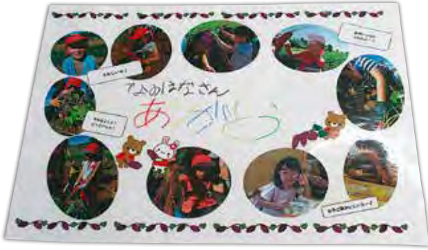
子供達からもらったお礼の写真

園長先生の「エイエイオー」のかけ声と共に園児らは泥だらけになりながら「あったあった」「わー大っきい」「すごい」など、みんな楽しんで収穫しました。最後に子供達から、お礼のメダルをもらいました。