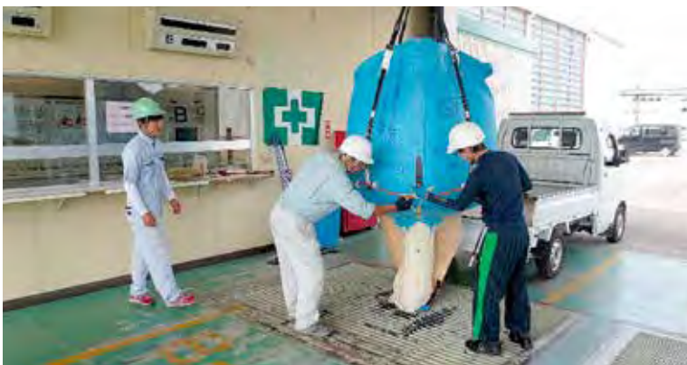
百塚カントリーエレベーターでのコシヒカリの荷受作業

当J A管内において、主力品種「コシヒカリ」約1, 814 haの収穫が始まり、百塚、呉羽、水橋の3つのカントリーエレベーターで荷受が行われました。 今後とも良質米の出荷と生産コストの低減及び作業の省力化のため、カントリーエレベーターのご利用をお願いいたします。