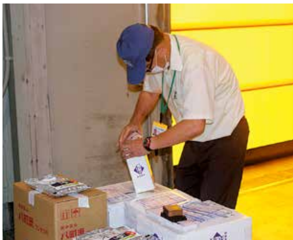
発送準備をする農協職員

組合員の方々にもご協力を賜り、新米が発売されるこの時期は、各地より多数の注文を受けております。