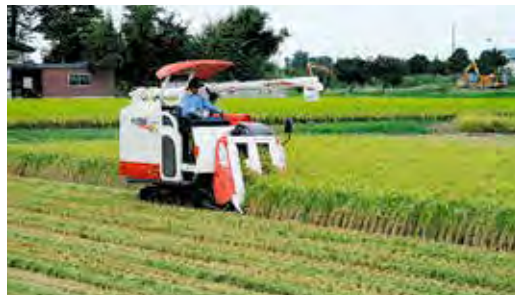
コシヒカリの刈取り 水橋支店管内