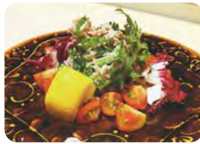
ツナと ゴーヤーのサラダ