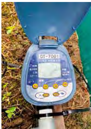
かん水タイマー装置