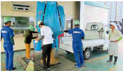
百塚カントリーでのコシヒカリの荷受作業