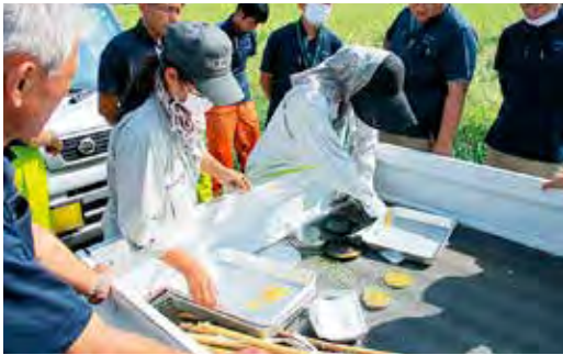
富山県農林振興センター職員と営農指導員によるほ場での刈取適期確認の様子