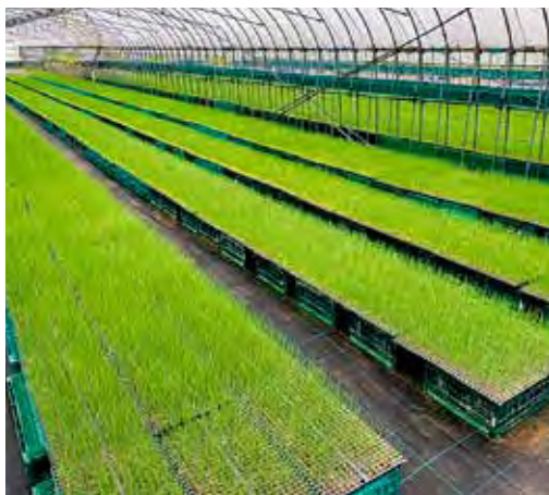
たまねぎ苗の様子

たまねぎは富山県の広域産地形成品目に指定されており県内全域で栽培が進められています。 また、なのはな農協ではスマート農業実証プロジェクトの一環として大規模圃場でのたまねぎ栽培を行っています。今後、水田の区画整理で大規模圃場も増えていく事が見込まれ、その水田を活用して高収益作物を作る事が必須となつていきます。スマート農業実証プロジェクトでは、大型の機械やスマート農機を利用して大規模栽培の省力化に取り組んでいます。 令和三年産たまねぎの播種が九月一日に行われました。播種作業は全農富山県本部が請け負い、各農協より依頼された枚数の播種を行い、育苗管理は生産者が行います。 なのはな農協では、900枚の苗(約1.8畝分)の管理を行っています。育苗期間中のかん水はスプリンクラーを使用し、タイマーで自動かん水する事が出来、労力の軽減にも大きな効果があります。その他の管理として、殺菌剤、殺虫剤、液肥の散布、葉が長くなりすぎないように行う剪葉(葉切り)等があります。 この苗は、10月中旬から下旬にかけて定植が行われる予定です。苗の出来が定植後の生育に大きく影響します。今後苗の様子を観察しながら、適切な育苗管理に努めてまいります。