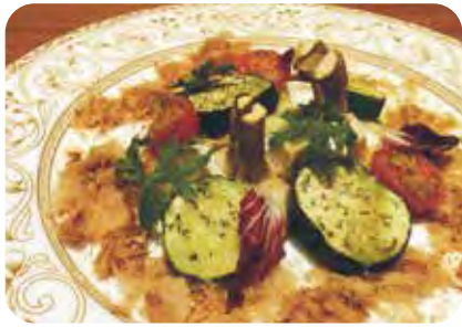
野菜のチーズ焼き