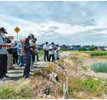
圃場巡回の様子 八ヶ山地区 白ねぎ圃場

同協議会では、昨年引き続き新型コロナウイルスの影響で、例年開催している会議や研修会が中止になっています。そんな中で感染予防対策を徹底して行った視察研修・役員会は数少ない情報交換の場として大変有意義なものとなりました。