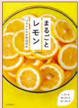
まるごとレモン ベストレシピBOOK 定価：1,500円+税

レモン好き必見! しぼり汁はもちろんだが、香りよい皮までも余すことなく使い切るこれまでにないレシピ集。料理・お菓子・保存食と幅広く紹介。栄養素や保存法など基本知識も網羅。レモンのすべてが丸わかり。