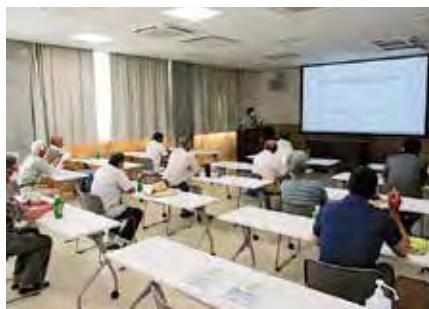
座学研修を受ける会員