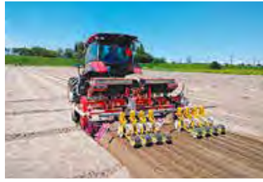
ロボットトラクターの直進キープ2畦同時成型施肥播種作業

スマート農業の実証は、ロボットトラクターによる耕起作業、ロボットトラクターの直進キープ機能を使用した2畦同時成型施肥・畝立て播