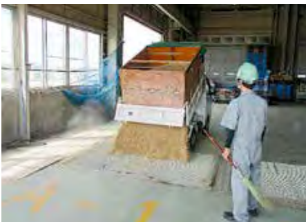
収穫されたてんたかくを荷受けするカントリーエレベーター