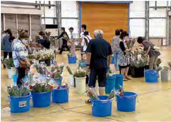
盆花を買い求めるお客様

農産物直売所は、お盆前の八月十一日から十五日まで切花の特売を行いました。毎年、イベントホールに盆花コーナーを設け、生産者の適切な処理で安心・新鮮な小菊・ユリ・アスター・季節の花々を多彩に取り揃えて特価販売しています。今年も新型コロナウイルス感染症予防対策として、スタッフはマスク着用での対応、三密への配慮、来場者への検温、アルコール消毒の徹底を行いました。この度の「盆花フェア」にご来場いただき、厚くお礼申し上げます。