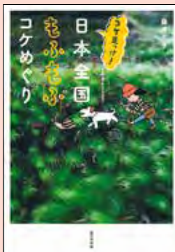
コケ見つけ! 日本全国もふもふコケめぐり 定価：1,700円+税

コケ愛好家による、全国のコケスポットの魅力とエピソードが詰まった初のガイドブック。街中や郊外などの身近な場所から、苔寺など旅先で観察したい名所まで多数紹介。観察方法や持ち物など基本情報も網羅。