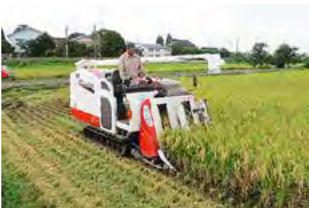
てんたかくの刈取 南部支店管内