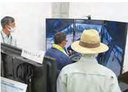
シミュレーター体験を受ける会員