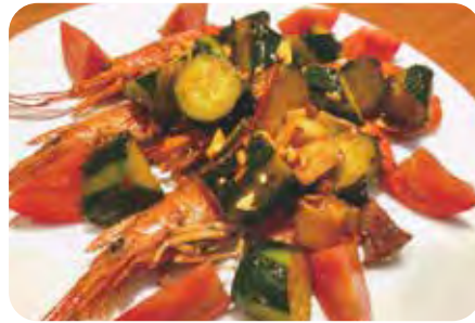
赤エビと キュウリの 香味炒め