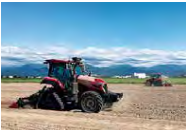
ロボットトラクターによる無人での耕起作業

スマート農業の実証は、ロボットトラクターによる耕起作業、ロボットトラクターの直進キープ機能を使用した2畦同時成型施肥・畝立て播