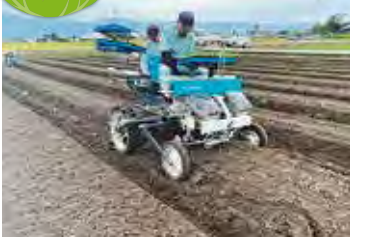
(農)高島営農 定植作業の様子