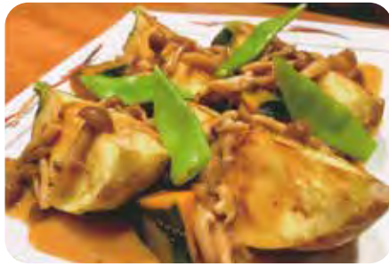
米ナスと カボチャの唐揚げ 西京みそソース