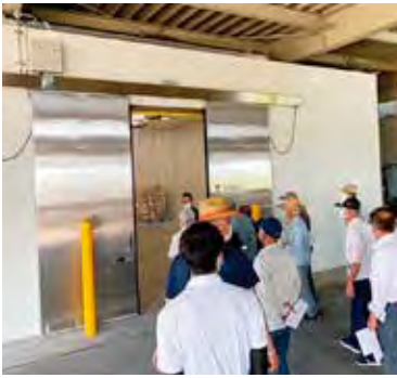
保冷設備視察の様子 なのはな農協野菜センター