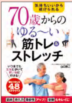
70歳からの ゆる〜い筋トレ&ストレッチ 定価：1,400円+税

介護事業経験のある著者が教える、介護予防のための筋トレ&ストレッチ。無理せずできる簡単なトレーニングで誰でも安心してはじめる。いつまでも元気に歩いて買い物に行ける体を作れば一生介護不要!