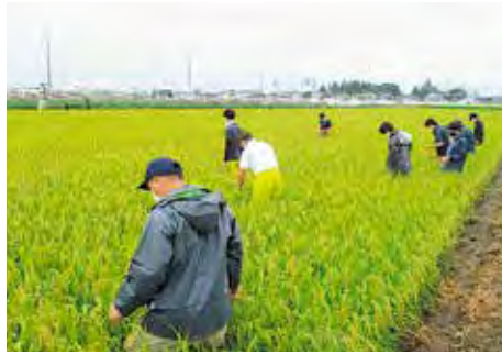
刈取適期巡回の様子