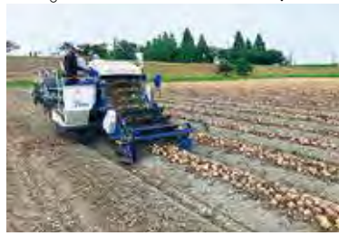
たまねぎのハーベスターでの収穫作業

当日は新型コロナウイルス感染症の拡大に伴い、見学等については最小限とし作業に関わるコンソーシアムメンバーのみでの作業となりました。