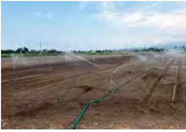
スプリンクラーでのかん水作業