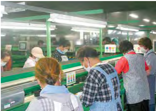
選果仕分けする様子

八月九日、なのはな農協呉羽梨選果場で、幸水の初選果が行われました。今年は春先の冷え込みによる遅霜の被害を受け、出荷量は例年の三割程度となりましたが、甘みの強い梨に仕上がっており、幸水を中心に十一月上旬までの出荷を見込んでいます。選果場直売所を中心に販売・発送を行っていますので、幸水だけでなく豊水・あきづき・新高・新興と、それぞれの品種の味覚をシーズンを通してお楽しみ下さい。