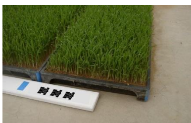
写真1：品種名の表示