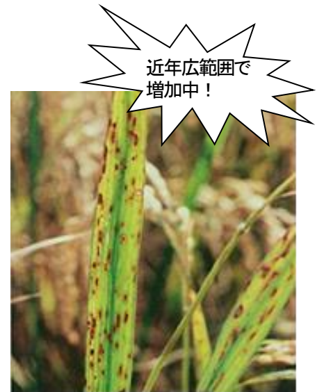
図 ごま葉枯病の病斑 (地力の低下が原因)

※発酵鶏ふんを春施用する場合は、基肥を窒素成分で1～2kg/10a 減肥する。 (例) Jコートコシヒカリ1号: 35kg/10a 施用の場合は、25kg～30kg/10a 程度に減肥する。