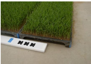
写真2 品種名の表示